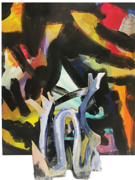
François Bauer « Le serpent », 2025 - Faïence, oxydes, émail. 22 x 28 x 83 cm « Le jeu du noir », 2025 - Acrylique sur papier. 50 x 65 cm Production : La Kunsthalle Mulhouse

La relation que François Bauer entretient avec ses objets se construit comme un dialogue exigeant. Il attend d'eux qu'ils le surprennent, peut-être même le débordent. Cette exigence se manifeste autant dans les formes qu'il pousse à leurs limites que dans un goût assumé pour l'absurde, utilisé pour s'affranchir des codes habituels de la céramique. Il construit un pot contre un pan de céramique qu'il orne des fleurs... qu'il n'est plus nécessaire de glisser dans le vase. L'objet devient peinture et l'artisan est artiste. Il n'apporte plus seulement un objet dans la pièce, il dessine un tableau et se fait peindre.