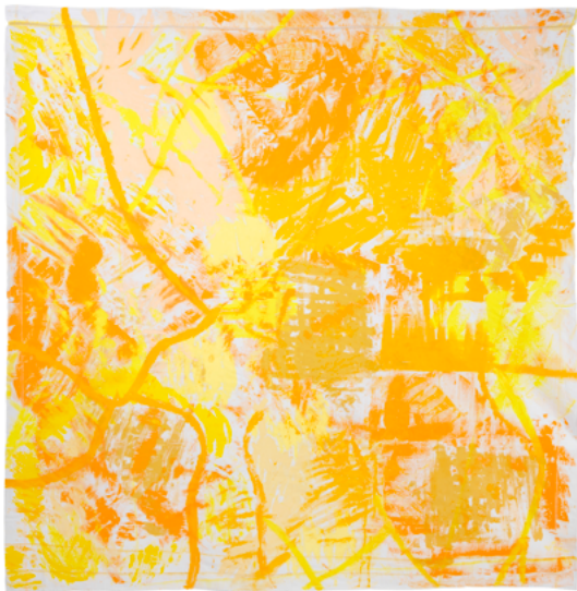
Christiane Fath, « Jaunes routes », 2025 Acrylique sur linge de maison, lin ancien. 232 x 237,5 cm Production : La Kunsthalle Mulhouse

A travers ses peintures, abstraites ou déconstruites, Christiane Fath raconte une histoire, souvent la sienne, celle de ses origines et de ses voyages. On voit que des espaces géographiques ont particulièrement marqué son parcours. Elle les réintroduit comme des motifs répétés sur une même toile ou d'une peinture à l'autre. La méditerranée est ainsi tracée par des lignes, possiblement d'écritures, les arrondissements parisiens de son enfance deviennent une forme reconnaissable et récurrente, on retrouve aussi des paysages vus d'avion, schématisés et reportés sur la toile.