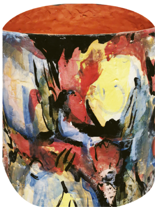
François Bauer, « Le Brouhaha », 2025 Faïence, oxydes, émail. 50 x 40 cm de diamètre Réalisé en partenariat avec l'IEAC de Guebwiller. Production : La Kunsthalle Mulhouse