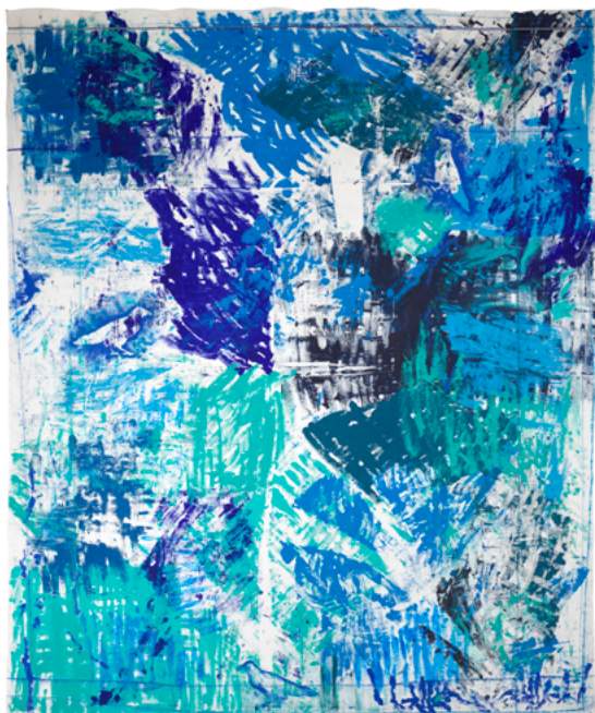
Christiane Fath, « Bleu corbeaux », 2025 Mine graphite, acrylique, pastels secs sur linge de maison, lin ancien. 240 x 284 cm. Production : La Kunsthalle Mulhouse

La Kunsthalle remercie Documents d'Artistes La Réunion et DCA (Association française de développement des centres d'art contemporain) qui ont permis de découvrir le travail de Christiane Fath.