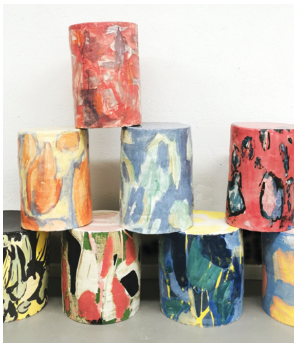
François Bauer, Série de Tabourets , 2025 Faïence, oxydes, émail. 40 x 29 cm Ø, 38 x 37 cm Ø Réalisé en partenariat avec l'IEAC de Guebwiller. Production : La Kunsthalle Mulhouse