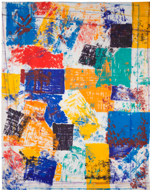
Christiane Fath, « Toutes couleurs », 2025 Acrylique sur linge de maison, lin ancien. 240 x 307 cm Production : La Kunsthalle Mulhouse

Au fil de ses peintures, Christiane Fath adopte un geste de plus en plus libre. Dans ses dernières œuvres, les couleurs jaillissent, les constructions sont de plus en plus complexes et abstraites et quand un motif figuratif apparaît, il témoigne d'un coup de cœur ou d'une surprise. Le plaisir semble prendre une place essentielle dans son travail, il dépasse l'intention et justifie à lui seul le projet de la peinture.