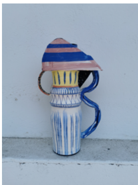
François Bauer, « Le vase de Minos », 2024 Faïence, porcelaine, engobes, oxydes, émaux sans plomb, émaux à froid, 52 x 31 x 16 cm

François Bauer a 39 ans. Il est né et a grandi à Annecy. Il est diplômé de l'IEAC de Guebwiller, de l'École supérieure des arts décoratifs et de l'université de Strasbourg.