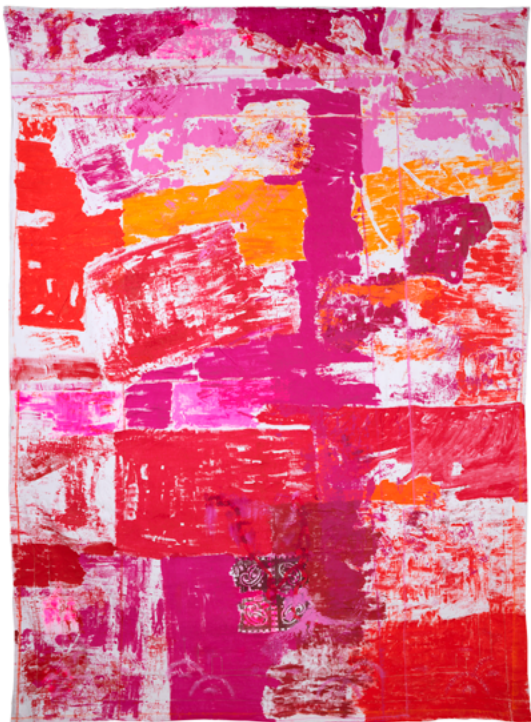
Christian Fath, « Rouge dentelle », 2025 Impression - Acrylique, collage sur linge de maison, lin ancien, 240 x 331,5 cm. Production : La Kunsthalle Mulhouse