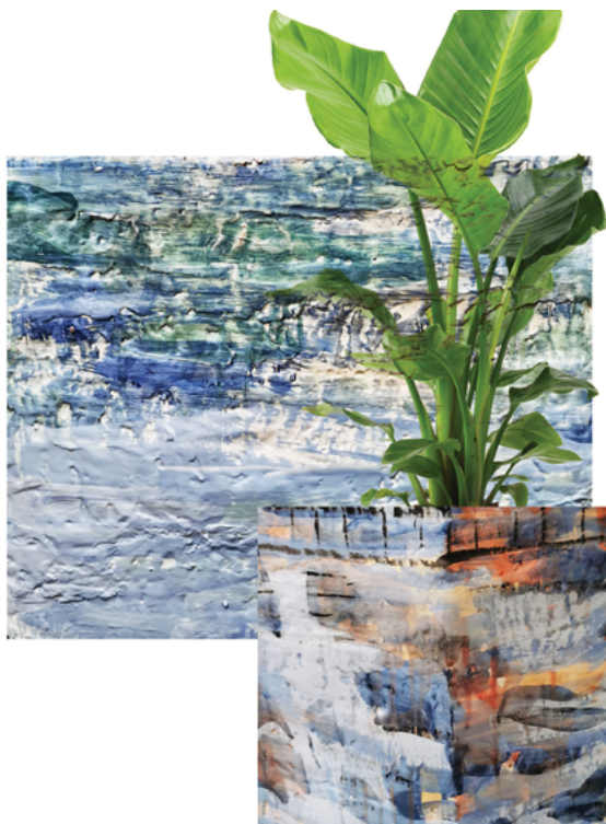
François Bauer, « Les pots du repos », 2025 Faïence, oxydes, émail. Dimensions variables Réalisé en partenariat avec l'IEAC de Guebwiller. Production : La Kunsthalle Mulhouse

Une nouvelle série de paysages de ruines en terre cuite, à mi-chemin entre la scénette kitch et le motif de peinture romantique est récemment apparue dans le travail de François Bauer. Construites à partir de fragments récupérés lors de la fabrication de ses poteries, elles forment des compositions presque abstraites et lui offrent un terrain idéal pour explorer la sculpture et son installation dans l'espace. Il les met en dialogue avec ses peintures, les installe sur socles ou devant ses peintures et compose ainsi un ensemble où chaque élément répond à l'autre et l'enrichit.