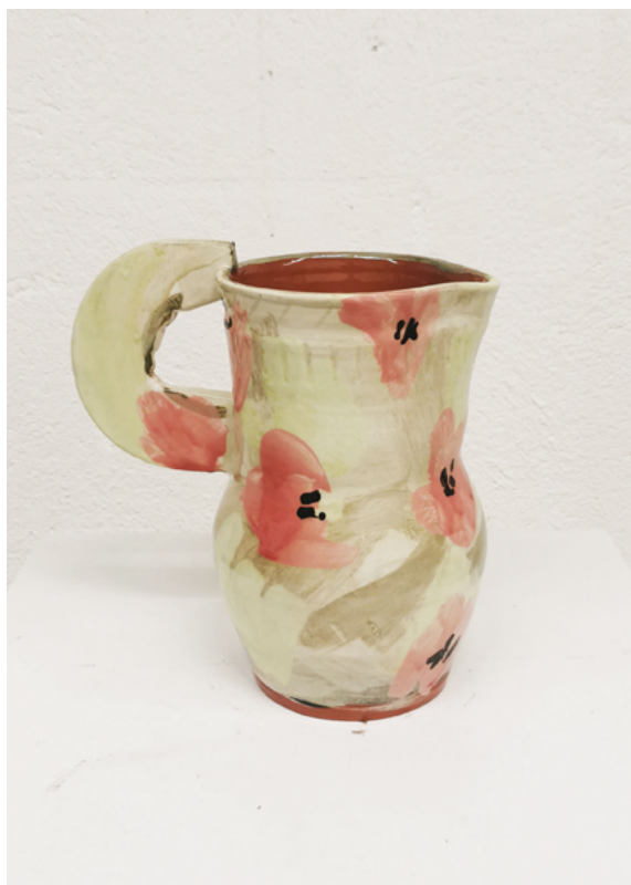
François Bauer, « Pichet les Coquelicots », 2025 Faïence, oxydes, émail. 23,5 x 22 x 13 cm Réalisé en partenariat avec l'IEAC de Guebwiller. Production : La Kunsthalle Mulhouse © photo : François Bauer

« Quand j'y pense, la forme est un domaine quasi infini. Il existe des milliards de formes et elles sont toutes riches de leurs spécificités. Dans le travail de l'argile, c'est le geste de la main ou de l'outil qui crée la forme. C'est important de voir les traces de la main, c'est un peu comme imprimer de ses empreintes digitales et de sa sueur sa production. C'est un peu comme dire zut à la pissotière de Duchamp. Faire soi-même, avec ses mains et ses outils. Empoigner l'argile comme on sert la main à un vieux copain. »