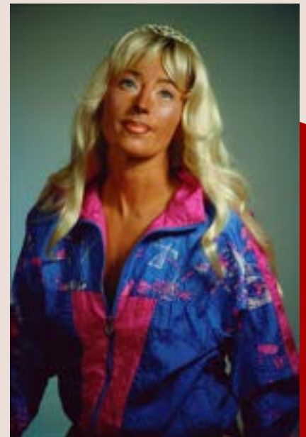
Cindy Sherman, Untitled #397, 2000.