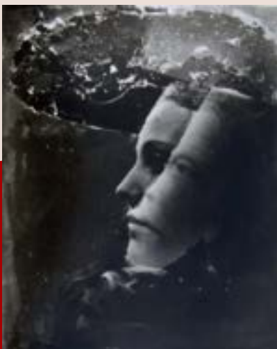
Dora Maar, Double portrait, 1930, photographie.