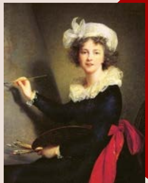
Louise Élisabeth Vigée Le Brun, Autoportrait, 1790, Musée des Offices, Florence