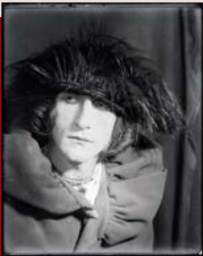
Man Ray, Marcel Duchamp en Rose Sélavy, 1921, photographie, bromure d'argent sur verre, 12x9cm, Centre Pompidou, Paris.

L'imaginaire est toujours un moyen de revenir au réel en étant chargé de nouvelles impressions, émotions, expériences et réflexions qui nous amènent à porter un autre regard sur ce que l'on vit.