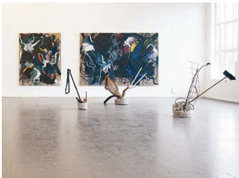
▲ Vue de l'exposition, Momentum 2009 5th Nordic biennale d'art contemporain - Moss, Norvège

LA KUNSTHALLE CENTRE D'ART CONTEMPORAIN MULHOUSE