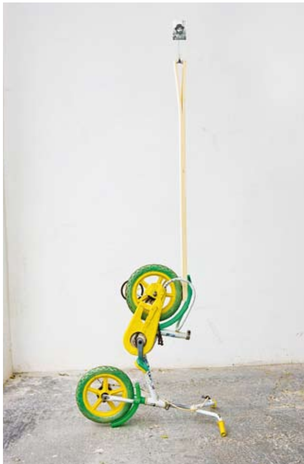
▲ Strutture con immagini Snow, 2009 – 40 x 60 x 171 cm courtesy de l'artiste, Galerie Monitor, Rome

Fresco Bosco, a cura di / curated by Achille Bonito Oliva, Certosa di Padula, Padula (Sa)