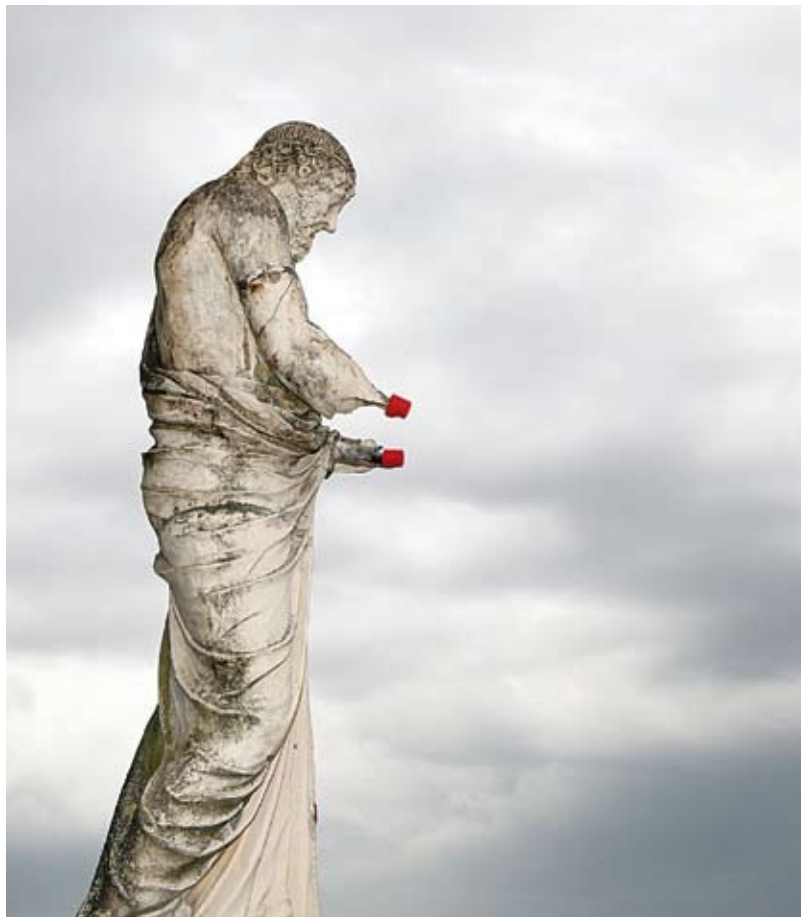
▲ sans titre , intervention au parc de Saint-Cloud, 22 juillet 2009 Lambda print 45 x 60 cm

2007 : Les artistes du Pavillon-Palais de Tokyo