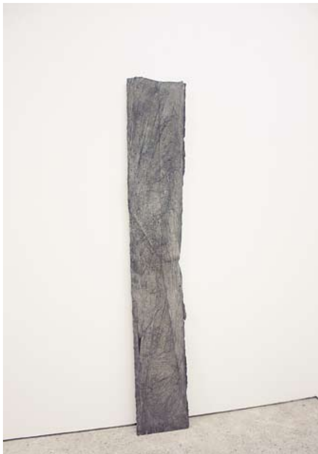
▲ yes-no, 2009

2008 : mountains and triangles, édition Forma