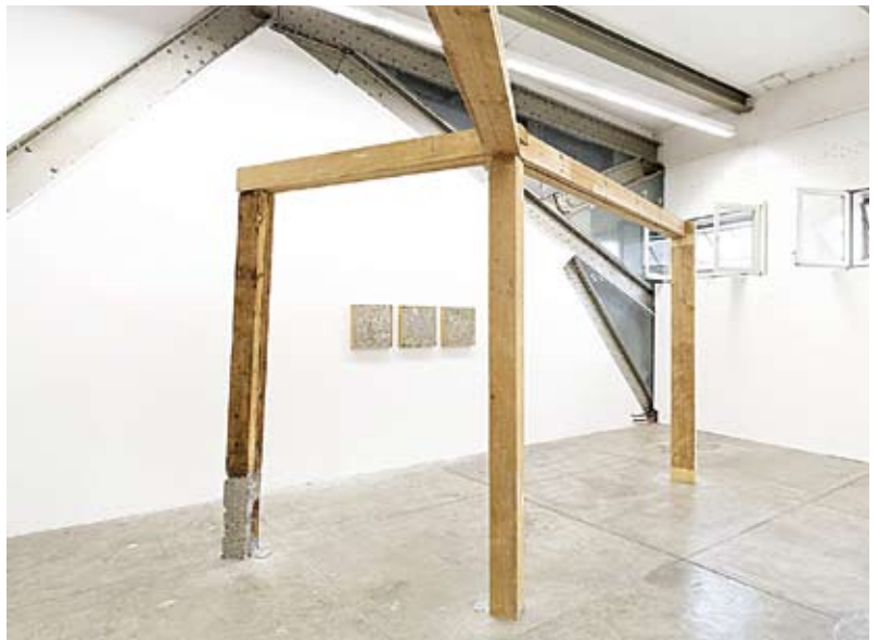
▲ Where I Lived and What I Lived for , 2007 Poutres en bois, béton, métal 324 x 640 x 235 cm