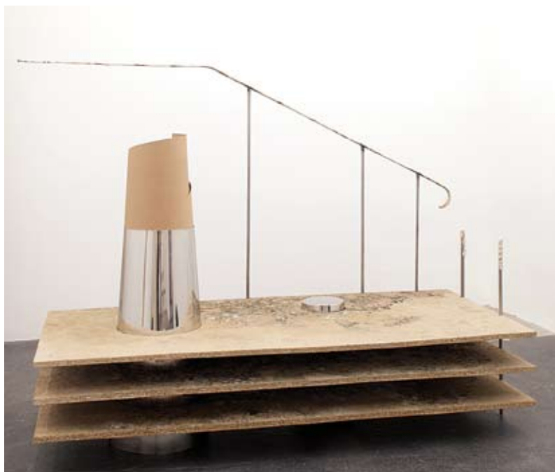
▲ Réplique de la chose absente, 2009 Bois aggloméré, inox, papier, métal, terre... 200 x 95 x 200 cm

Oublier l'anneau de l'horizon - FRAC Bourgogne