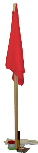
Laurent Bechtel, Non lieu, 2007

Nous avons décidé de planter le drapeau de l'art comme les inventeurs d'une terra incognita . A l'image du Drapeau maintenu en équilibre par les éléments ayant servi à sa construction (2007) de Laurent Bechtel, l'exposition « La première fois » est une sorte de maquette précaire. Cette balise donnera aux artistes un repère pour planter leur tente ou poser leurs valises. Certains disposeront seulement des images. D'autres bâtiront des pièces plus imposantes, œuvres-demeures ou œuvres-panoramas. A l'image de ce plateau d'un seul tenant, les travaux seront exposés sans cloisonnement. Pour la première fois, il s'agira d'affecter de nouveau un lieu désaffecté.