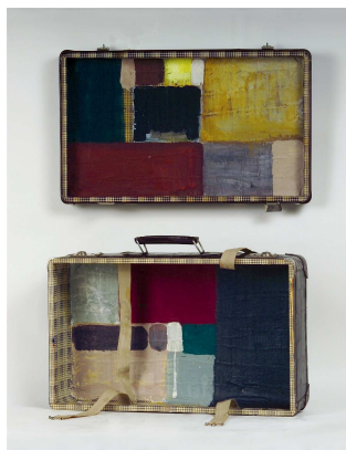
Verena Schönhofer, Packen I, 2004